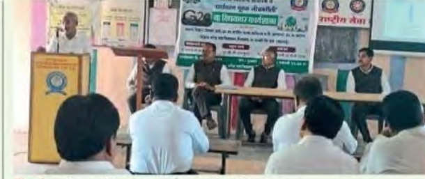
पिंपळनेर : वरिष्ठ महाविद्यालयात कार्यक्रमप्रसंगी उपस्थित मान्यवर.