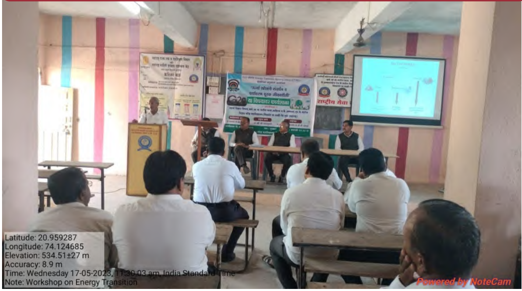
Latitude: 20.959287 Longitude: 74.124685 Elevation: 534.51±27 m Accuracy: 8.9 m Time: Wednesday 17-05-2023, 11:39:03 am, India Standard Time Note: Workshop on Energy Transition