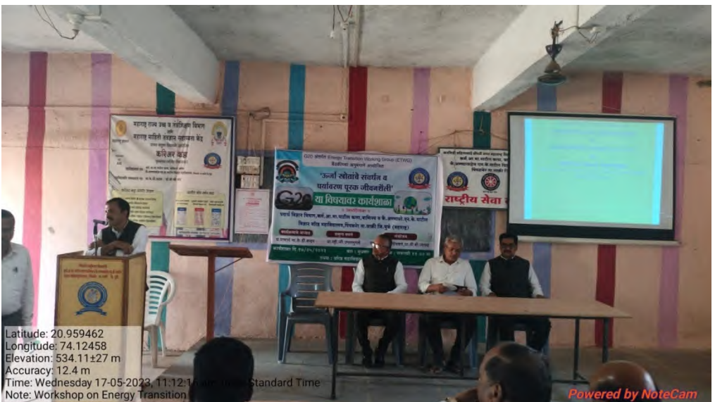
Latitude: 20.959462 Longitude: 74.12458 Elevation: 534.11±27 m Accuracy: 12.4 m Time: Wednesday 17-05-2023, 11:12:10 am, India Standard Time Note: Workshop on Energy Transition