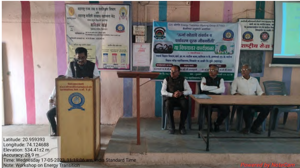
Latitude: 20.959393 Longitude: 74.124688 Elevation: 534.41±2 m Accuracy: 29.9 m Time: Wednesday 17-05-2023, 11:19:06 am, India Standard Time Note: Workshop on Energy Transition