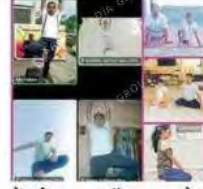
दोंडाईचा : ऑनलाइन योगा करताना पालकांसह विद्यार्थी.