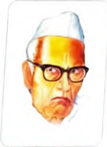
कर्मवीर आनंदराव माणिकराव पाटील उर्फ बंडू बापूजी

जन्म दि. २९.०८.१८९३ मृत्यु दि. ०९.०९.१९८१