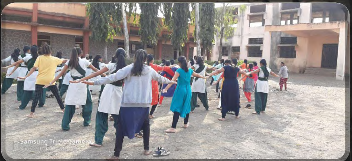
Samsung Triple Camera Shot with my Samsung A71