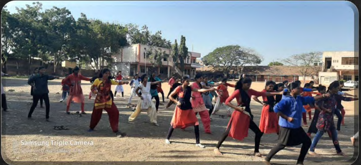
Samsung Triple Camera Shot with my Samsung A71