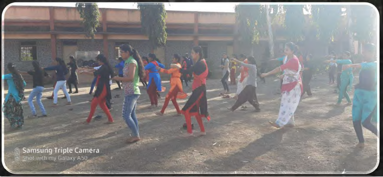
Samsung Triple Camera Shot with my Galaxy A50