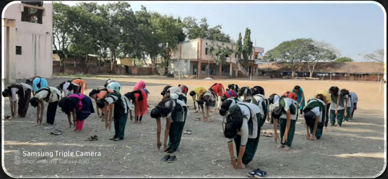
Samsung Triple Camera Shot with my Galaxy A50