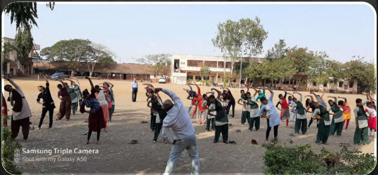
Samsung Triple Camera Shot with my Galaxy A50