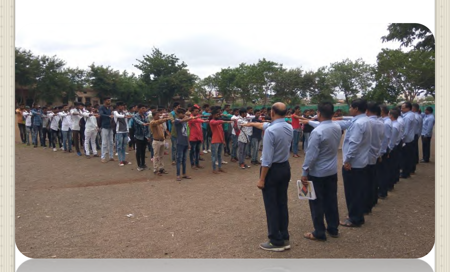
5. National Voters Day: Voters' Pledge : 25 January 2019