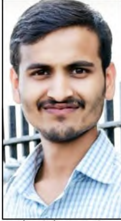
लाभले. संस्थेच्या महाविद्या- लयाच्या यशात या विद्यार्थ्यामुळे