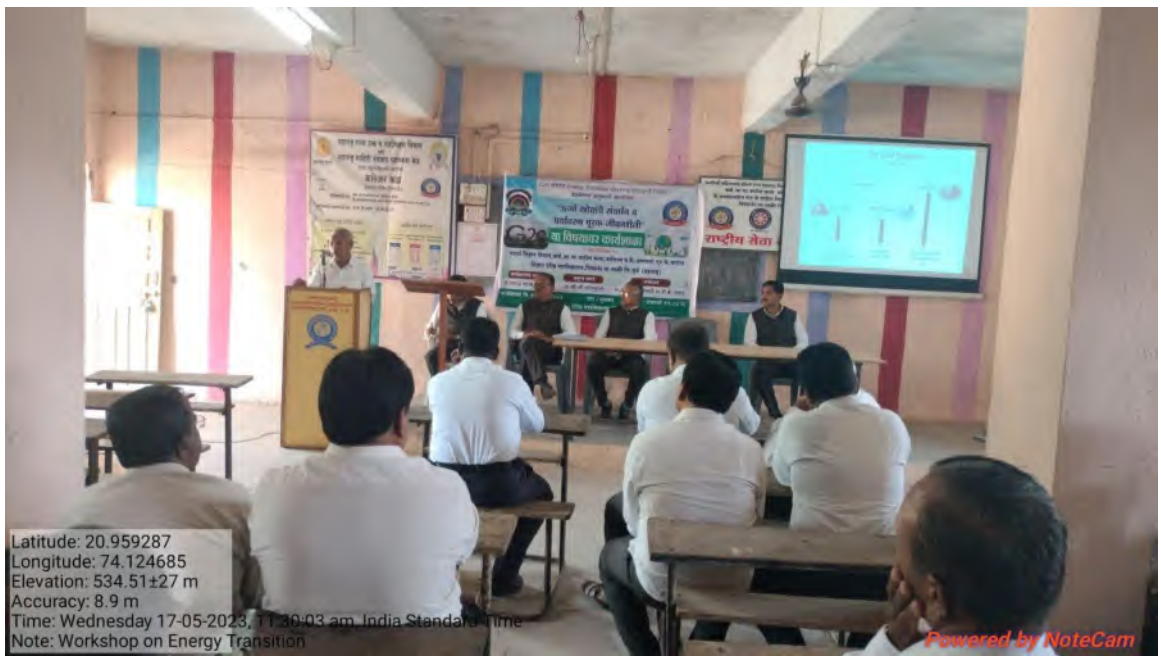
Latitude: 20.959287 Longitude: 74.124685 Elevation: 534.51±27 m Accuracy: 8.9 m Time: Wednesday 17-05-2023, 11:30:03 am, India Standard Time Note: Workshop on Energy Transition