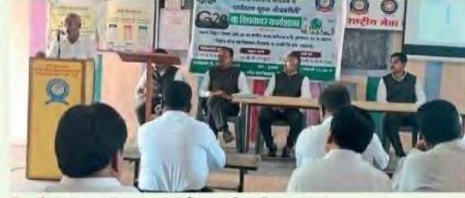
पिंपळनेर : वरिष्ठ महाविद्यालयात कार्यक्रमप्रसंगी उपस्थित मान्यवर.