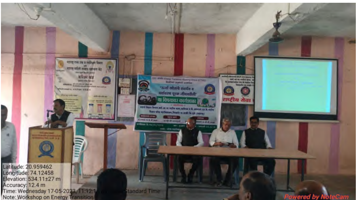
Latitude: 20.959462 Longitude: 74.12458 Elevation: 534.11±27 m Accuracy: 12.4 m Time: Wednesday 17-05-2023, 11:12:11 am, India Standard Time Note: Workshop on Energy Transition