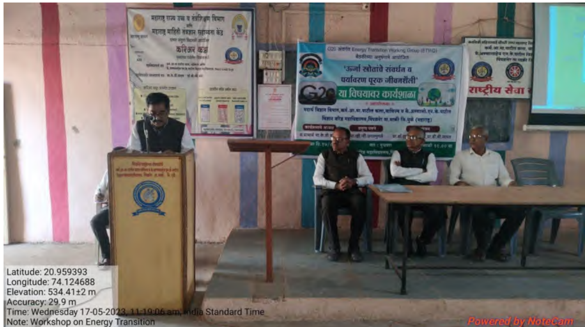
Latitude: 20.959393 Longitude: 74.124688 Elevation: 534.41±2 m Accuracy: 29.9 m Time: Wednesday 17-05-2023, 11:19:06 am, India Standard Time Note: Workshop on Energy Transition